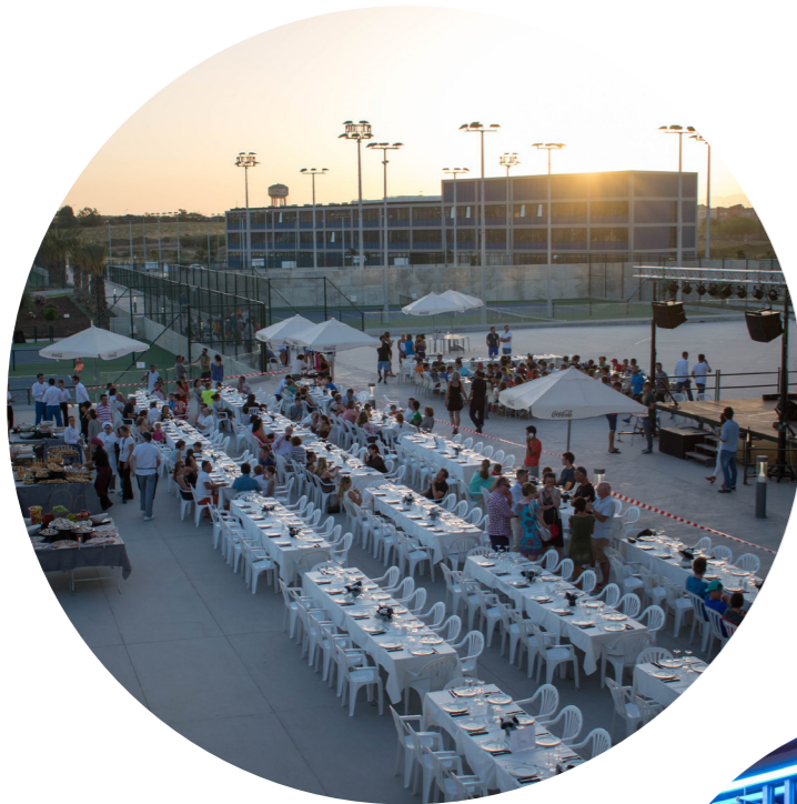
Rafael Nadal Rafael Nadal Academy